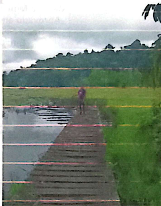
Foto 2 (Estado do trapiche): "Estrutura de madeira desgastada e com vãos, oferecendo risco de acidentes para moradores e alunos durante o embarque."

Foto 1 (Entorno e acesso): "Dificuldade de acesso e falta de um ponto de atracamento seguro para as embarcações que atendem a comunidade."